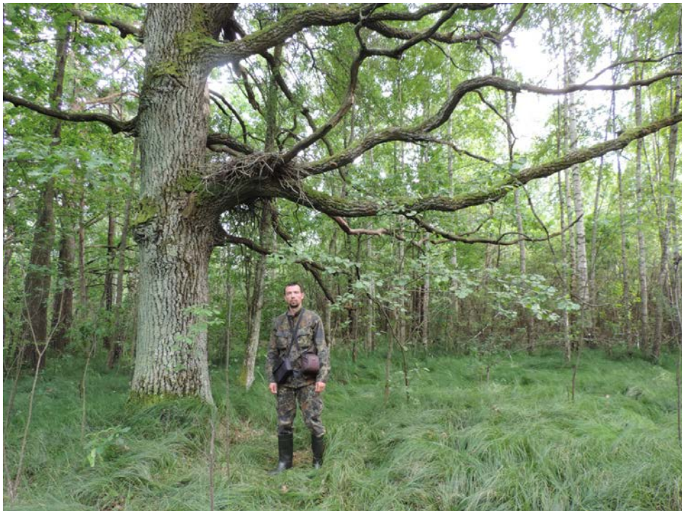
Рис. 2. Гніздо чорних лелек у 18 вид. 28 кв. Звягельського л-ва в 2021 році

08.07.2023 року у тому ж вид. було знайдено ще одне гніздо, яке знаходиться за 120 м на північ від попереднього гнізда. Гніздівля була збудована навесні цього ж року. Найімовірніше її зробила пара лелек, яка гніздилась раніше в 10 вид. 34 кв., після того як там провели рубку, оскільки по прямій між цими гніздами невелика відстань – менше 1 км. Під нею було багато посліду дорослих птахів, але невідомо чи вони роз-