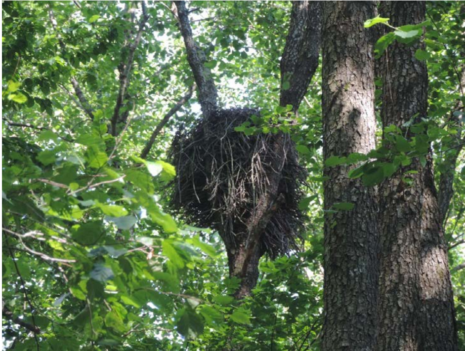
Рис. 3. Гніздо чорних лелек у 3 вид. 70 кв. Надслучанського л-ва в 2022 році

ставок на лісовій річці знаходиться за 780 м від гнізда, населений пункт за 2,1 км, край лісового масиву за 3,1 км.