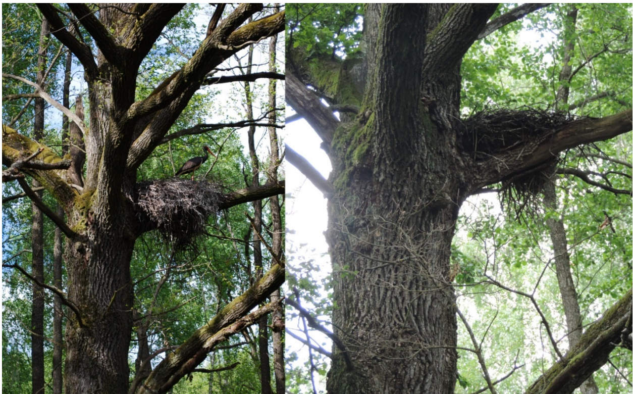
Рис. 1. Гніздо чорних лелек у 13 вид. 65 кв. Звягельського л-ва в 2009 (ліворуч) та 2021 (праворуч) роках

Дана гніздівля розташована на розвилці бічної гілки біля основного стовбура дуба на висоті 8 м і знаходиться на схід від стовбура. Окружність гніздового дерева дорівнює 342 см, тобто йому до 300 років. Воно росте у частково заболоченій березово-вільховій ділянці з окремими дубами. Дерево стоїть серед галявини розміром при-