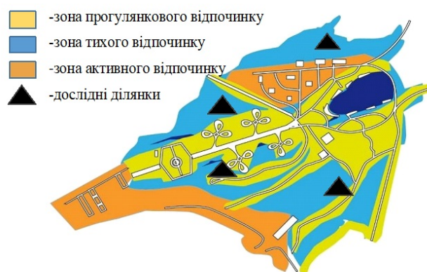
Рис. 1. Функціональне зонування парку «Зелений гай»

стилки здійснювали на території зелених насаджень парку «Зелений гай» на обраних задалегідь типових облікових майданчиках розміром 50×50 см. Зібрану підстилку розділяли за фракціями, отримані проби зважували. Вирахували середню з усіх облікових майданчиків масу лісової підстилки перераховували на площу 1 м 2 . Для об'єктивного аналізу характеристик лісової підстилки дослідні площі були закладені у зоні тихого відпочинку парку, на території, що не використовується для масового відвідування містянами (рис. 1). Під час добору дослідних ділянок головною ідеєю було обрання максимально однорідних частини екосистем, що володіють основними репрезентативними властивостями насаджень. Процес відбору проб підстилки здійснено за таким принципом розташування шаблонів: обиралася типова для місцевості ділянка, у випадку трапляння у зоні відбору проб великих гілок або скупчення кори та шишок їх оминали, відбір проби здійснювався на відстані не більше 1–1,5 м від стовбура дерева.