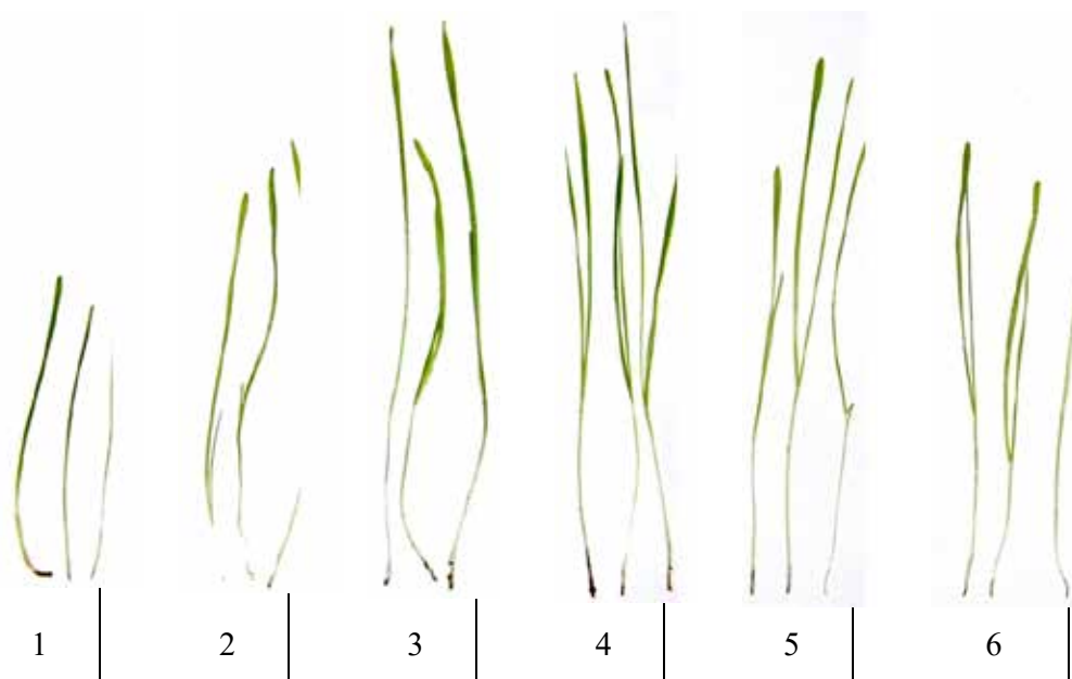
Рис. 1. Дослідні рослини під час проведення дослідів з прямого біотестування

На рисунку 2 представлені результати вивчення активності каталази в ґрунті при повторному вирощуванні ехінацеї бідої. Отримані дані дозволяють зробити висновок про більш високу каталазну активність ґрунту при вирощуванні ехінацеї порівняно із контролем, що свідчить про позитивну