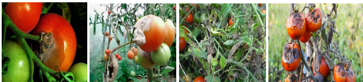
Рис. 3. Основні ознаки ідентифікованих хвороб томата в умовах дослідю (послідовно зліва – на право: сіра гниль ( Botrytis cinerea Fr.), біла гниль ( Sclerotinia sclerotiorum (By), бура плямистість ( Cladosporium fulvum Ске), фітофтороз ( Phytophthora infestans By)).