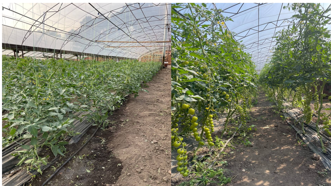
Рис. 1. Загальний вигляд робочої секції плівкової теплиці вирощування томату гібриду Порпора (F1) у досліді, 2025 рік

проникнення фунгіцидів у рослини (знижує поверхневий натяг розчину, забезпечуючи економію до 25% препаратів та підвищує їх ефективність).