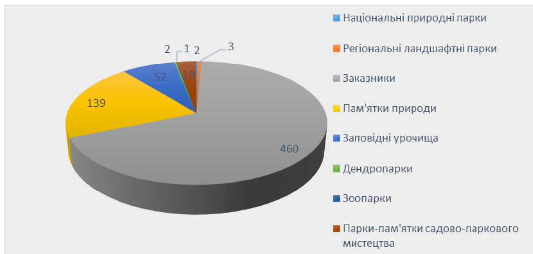
Рис. 1. Структура територій та об'єктів ПЗФ Чернігівської області за кількістю, шт (станом на 01.01.2023)

За кількістю в структурі ПЗФ Чернігівської області переважають заказники та пам'ятки природи (рис. 1).