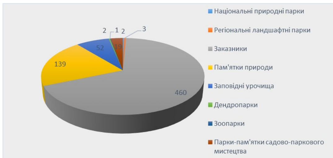
Рис. 1. Структура територій та об'єктів ПЗФ Чернігівської області за кількістю, шт (станом на 01.01.2023)

За кількістю в структурі ПЗФ Чернігівської області переважають заказники та пам'ятки природи (рис. 1).