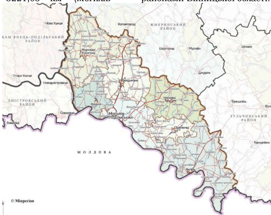
Рис. 4. Територіальні громади Могилів-Подільського району Вінницької області (Могилів-Подільський район)

Подільський район, 2020). До цього району увійшло сім територіальних громад (2 міських, 3 селищних та двох сільських; рис. 4, табл. 2 ) у складі 195 населених пунктів (2 міст, 3 селищ і 190 сіл та селищ). Чисельність населення становить 144 647 осіб та є найменшою у порівнянні з іншими районами Вінницької області.